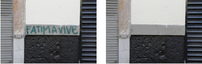
Imagen 6. Diana Cano “La urgencia de borrar”, 2019.

Por su parte, Restauradoras con Glitter , una colectiva independiente de mujeres que se especializa en el estudio, conservación y restauración de las herencias culturales, unidas en la lucha contra la violencia machista, reflexiona a tres años de su surgimiento: