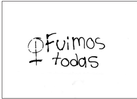
Imagen 4. DianaCano. “Borré las paredes de las pintas”, 2019.

“Borrar es un acto político” Diana Cano (Colmenero, 2017)